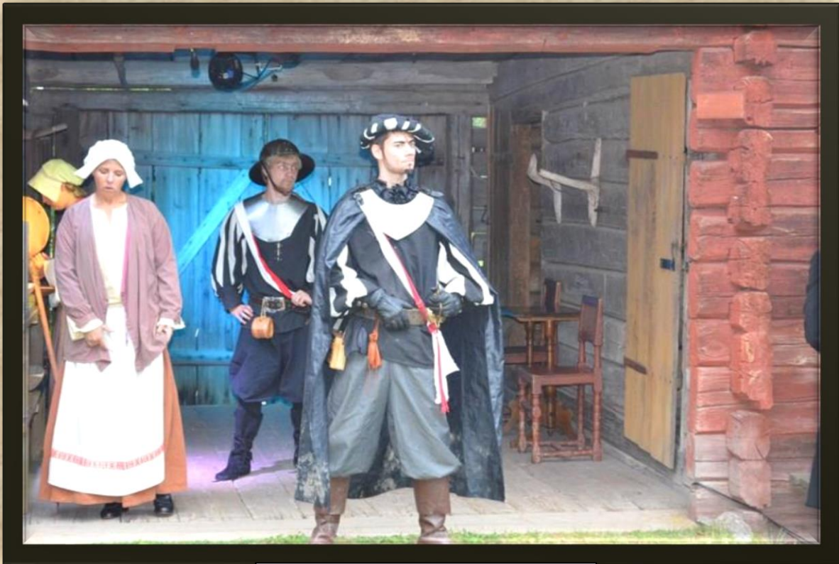
Foto från skådespelet Gustav Vasa i Svärdsjö 2015